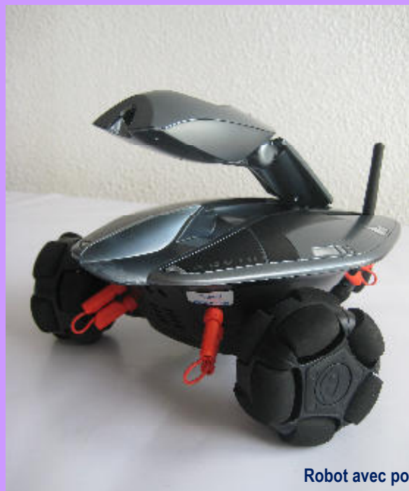
Robot avec points de mesure