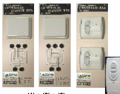
(1) + (2) + (3)