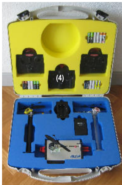
Photo des trois maquettes